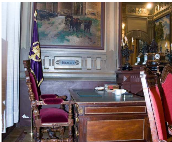
Despacho de Azaña

El despacho de Azaña es uno de los lugares emblemáticos del Ateneo de Madrid, donde está colgado su retrato y mantiene la mesa y la silla que utilizó el político. El autor del retrato de Manuel Azaña es Enrique Segura Iglesias (1966). Hoy, tras la actual rehabilitación del edificio histórico del Ateneo, el despacho de Manuel Azaña ha recobrado luz y está pendiente de su inauguración. Asimismo, la Biblioteca del Ateneo conserva más de un